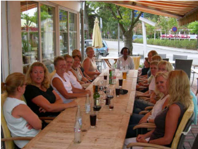
Det skal være usagt, om der er sand på gulvet.