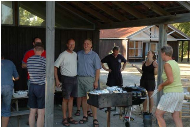
Der er tændt op i grillen til party mandag aften.

Jeg har hørt, at den planlagte fællesspisning skulle have været rigtig god. Oksemørbrad på grillen, og med dertil hørende forskellige kartoffelretter, og hvad der ellers måtte være.