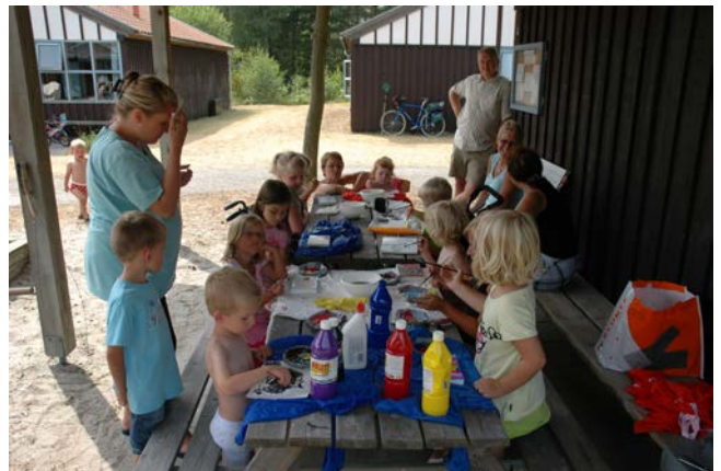
Der er gang i malergrejet.

Vi kan altid bruge nogle som gerne vil, også selv om det er uopfordret, til at tage initiativ til aktiviteter eller anden form for deltagelse fra foreningsmedlemmerne.