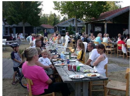
Alle har fundet deres plads på den store grillaften.